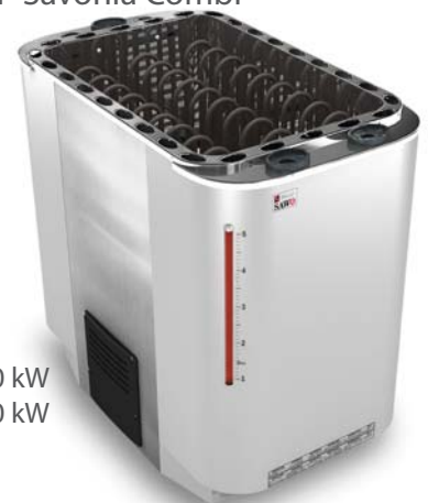
Super Savonia Combi